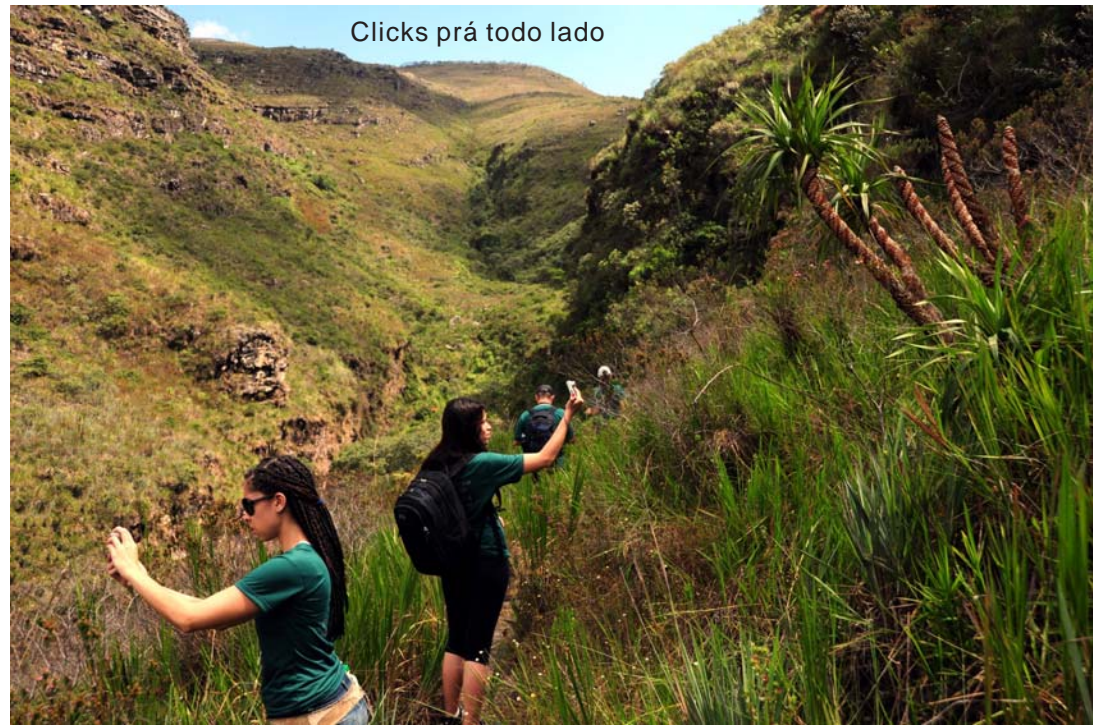
Clicks prá todo lado