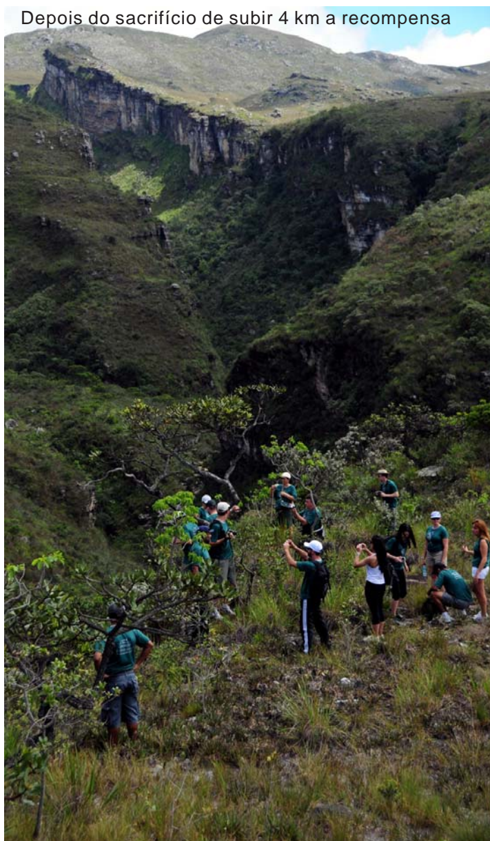
Depois do sacrifício de subir 4 km a recompensa