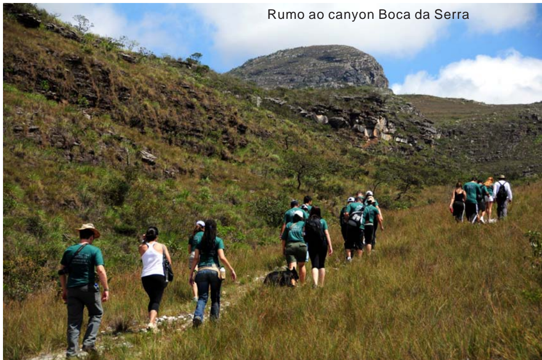
Rumo ao canyon Boca da Serra