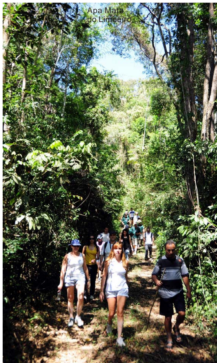
Apa Mata do Limoeiro