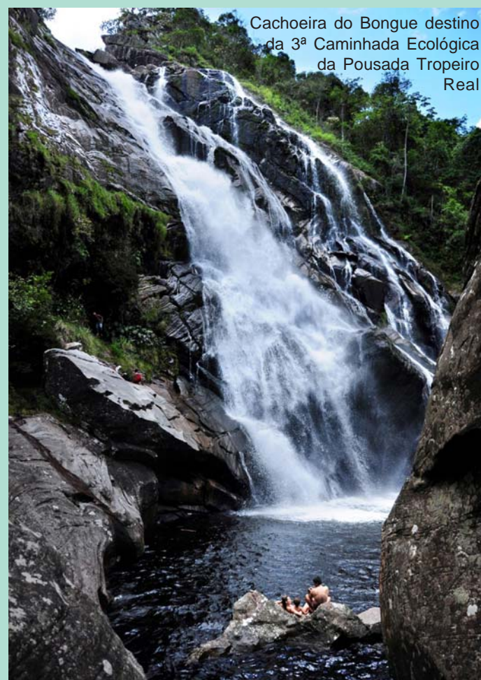
Cachoeira do Bongue destino da 3ª Caminhada Ecológica da Pousada Tropeiro Real

Em Duas Pontes haverá apresentações das entidades envolvidas no