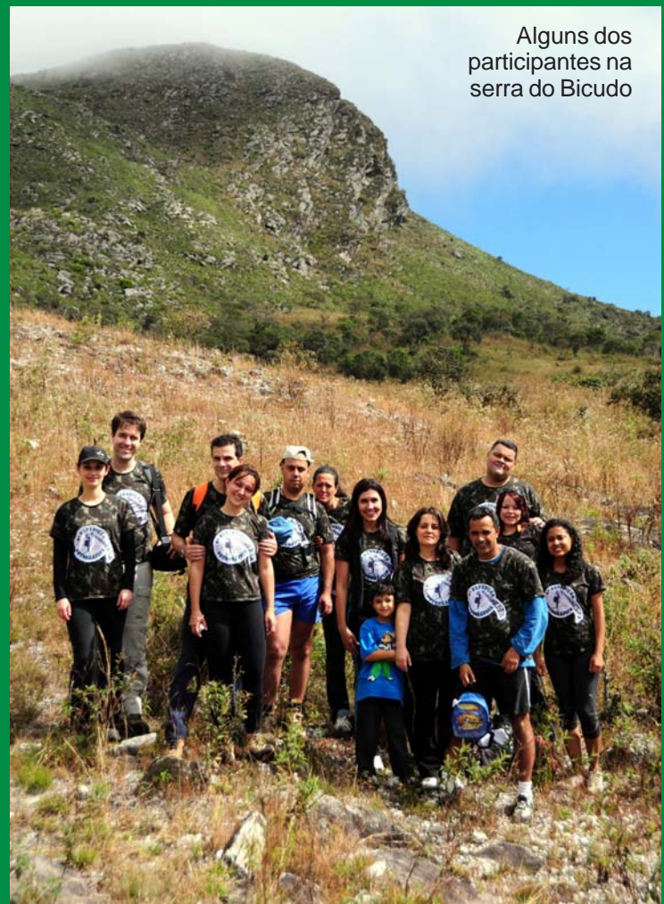
Alguns dos participantes na serra do Bicudo